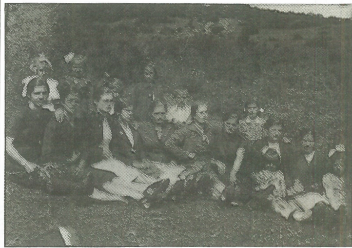
Διακρίνονται κοπέλες του χωριού μας στην Αγία Παρασκευή. Ίσως μερικοί αναγνωρίζουν τον εαυτό τους και θυμηθούν τα νιάτα τους