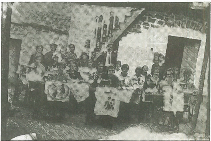
Φωτογραφία από 1925. Ίσως ανάμεσα στις κοπέλες που εκπαιδεύονται στη ραπτική αναγνωρίζει κάπως τη μάνα του ή τη γιαγιά του